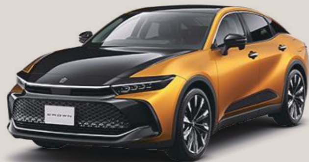
Photo:CROSSOVER RS"Advanced"(2.4Lターボハイブリッド車)。 ボディカラーのブラック(227)×プレシャスレイ(5C4)[2YA]<165,000円>はメーカーオプション。