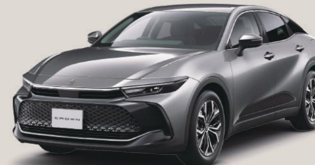
Photo:CROSSOVER G"Advanced"(2.5Lハイブリッド車)。 ボディカラーのプレシャスメタル(1L5)<55,000円>はメーカーオプション。